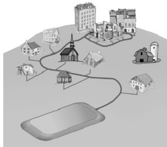
Figure A1 : L'assainissement collectif

Dans les zones urbaines , les villages, la ville, là où la densité de la population le justifie, les eaux usées sont canalisées vers des ouvrages de traitement collectifs, les étangs d'épuration des eaux usées.