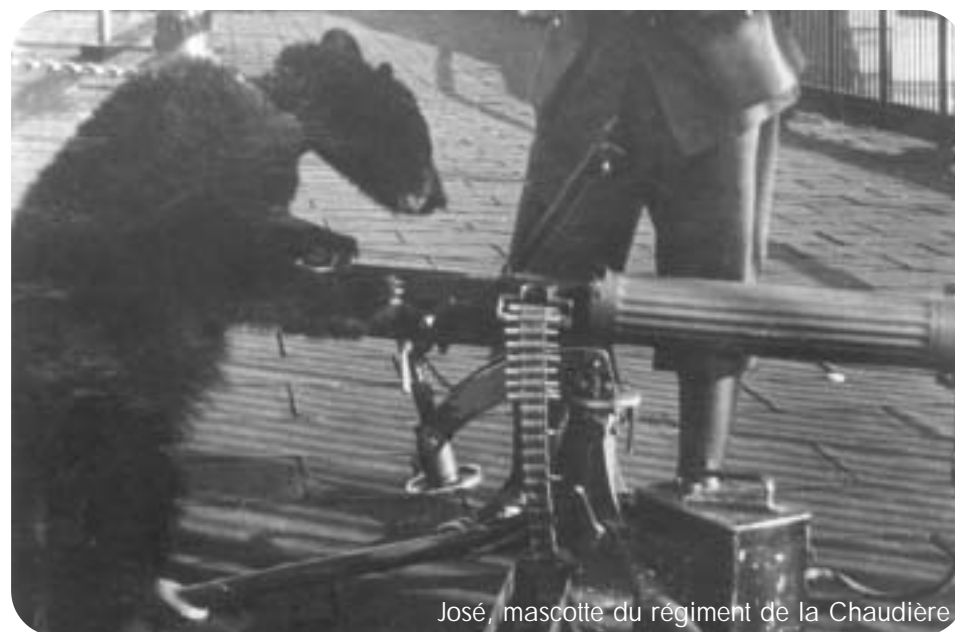
José, mascotte du régiment de la Chaudière