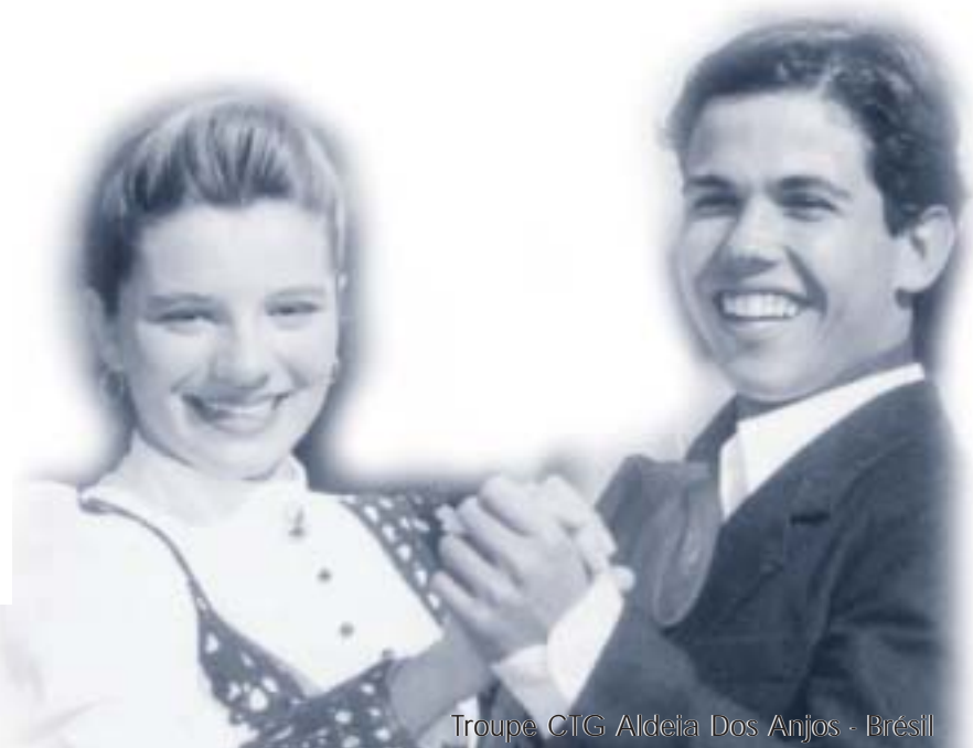
Troupe CTG Aldeia Dos Anjos - Brésil

Du 28 juin au 1 er juillet 2001 Sur le site historique du manoir Taschereau