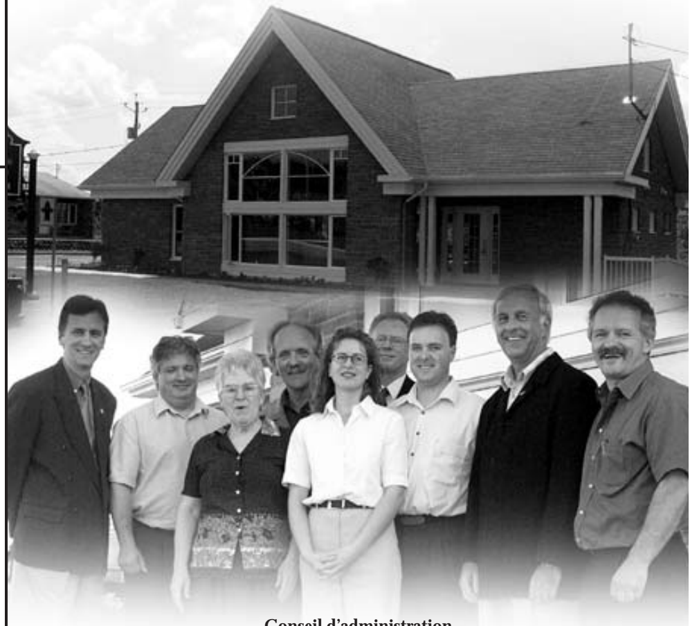
Conseil d'administration Corporation de développement touristique de Sainte-Marie inc.