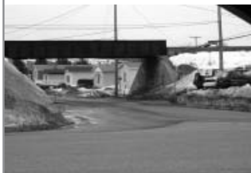
Intersection 3 route Chassé et boul. Vachon Nord

Lorsque vous êtes sur le boulevard Vachon en direction nord, le mur de béton soutenant le viaduc empêche de voir le trafic venant de la route Chassé en direction est (vers le centre commercial).