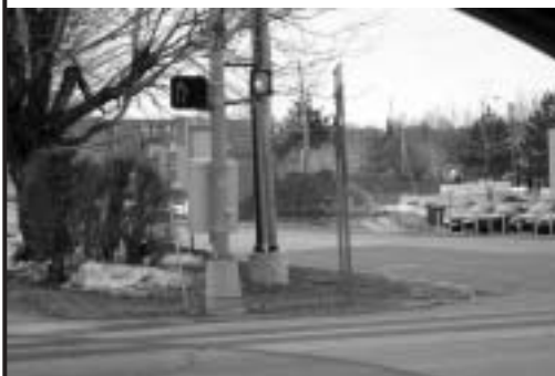
Intersection 2 Boul. Vachon Sud et Carter (photo)

Lorsque vous êtes sur Vachon, direction sud, les poteaux et la boîte de contrôle à votre gauche empêchent de voir le trafic qui descend Carter vers le boulevard.