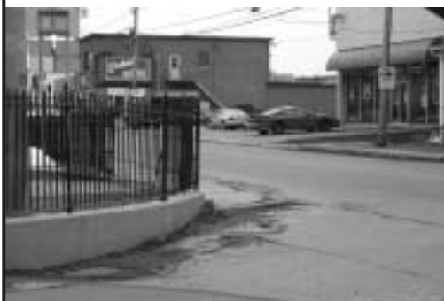
Intersection 1 Saint-Antoine et Notre-Dame Nord

Lorsque vous êtes sur Saint-Antoine, face au pont, la clôture du couvent des sœurs de Béthanie empêche de voir le trafic qui circule sur Notre-Dame, du sud vers le nord.